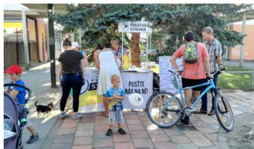
Objížďeli jsme Prahu 12 s infostánkem s připomínkami k metropolitnímu plánu

Hluk z dopravy trápí obyvatele nejen Komořan. Zdrojem hluku jsou dopravní stavby v jejich okolí. V některých oblastech se dokonce hluk sčítá z několika dopravních staveb. Nejhorší je hluk v nočních hodinách, když začnou jezdit kamiony a budí lidi ze spaní. Na pražském silničním okruhu dosud nejsou realizována všechna protihluková opatření, která jsem v roce 2000 jako náměstkyně ministra životního prostředí požadovala ve stanovisku posuzování vlivů na životní prostředí. Podařilo se mi ze znalosti místa prosadit, aby okruh mezi Cholupicemi a Točnou