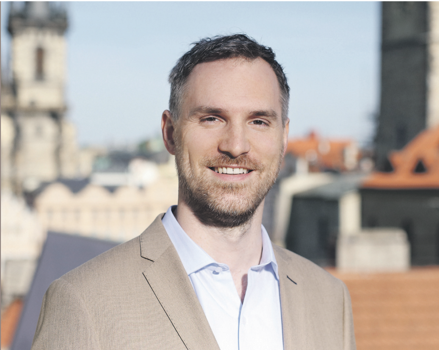
MUDr. Zdeněk Hřib, manažer a informatik, kandidát Pirátů na primátora Prahy