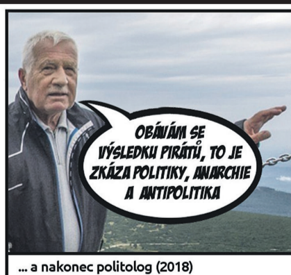
... a nakonec politolog (2018)

PIRÁTSKÁ STRANA Piráti uvádí komiks: Mnoho talentů Václava Klause