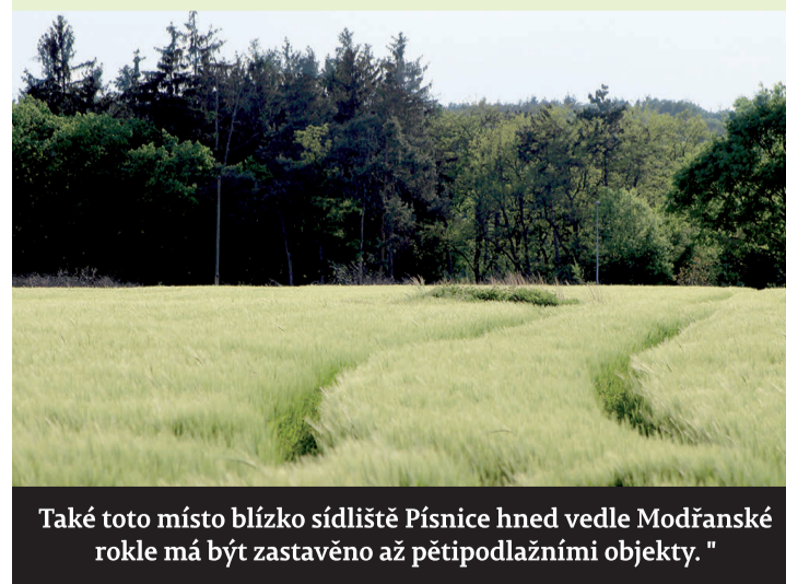
Také toto místo blízko sídliště Písnice hned vedle Modřanské rokly má být zastavěno až pětipodlažními objekty.

velmi špatně žije, teploty dosahují tropických hodnot, pokud budou teploty ještě stoupat a vlny veder budou delší, bude docházet k úmrtím. Je tedy životně důležité zachovat zeleň, která pokud je o ni dobře pečováno, dokáže snížit teplotu a zvýšit vlhkost vzduchu. Každý trávník, každý jeden strom může v budoucnu znamenat mnoho. Nenechme je zastavět.